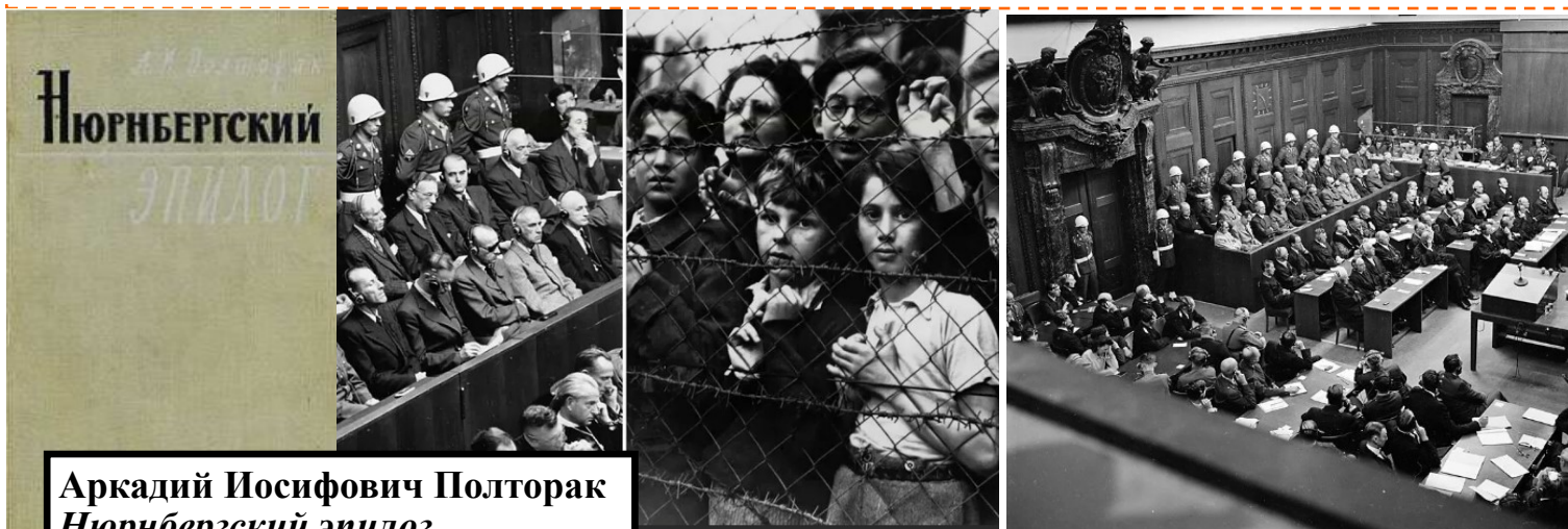
Аркадий Иосифович Полторак Нюрнбергский эпизод

Обвинитель от СССР Р.А. Руденко указал, что в священной памяти советских людей хранятся имена безвинно погибших и потерпевших от фашистского террора. «Исторический смысл процесса в том, что человечество не имеет право забыть о понесенных потерях» – подчеркнул Руденко.