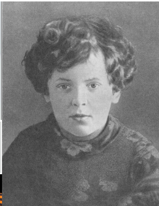
Лариса Михеенко, пионер-герой

Была земля и жесткой, и метельной, Была судьба у всех людей одна, У них и детства не было отдельно, А были вместе детство и война.